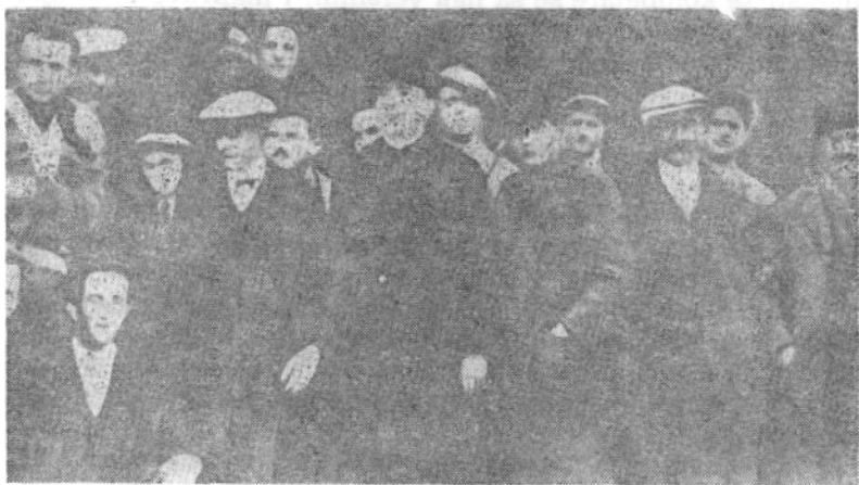
Pamje nga greva e punëtorëve të shoqërisë AIPA në Kuçovë

AIPA, sipas këshillave të atasheut ushtarak italian në Tiranë, krijoi «shërbimin e informacionit dhe të propagandës» që kishte për qëllim zbulimin dhe marrjen e masave paraprake kundër çdo manifestimi të «dëmshëm» për kapitalistët italianë.