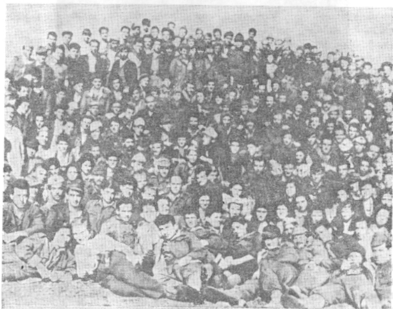
Delegatë të Kongresit I të BRASH

Si hallkën kryesore të kryengritjes së përgjithshme popullore Konferenca përcaktoi krijimin e Ushtrisë Nacionalçlirimtare. Formimi i kësaj ushtrie ishte bërë një nga detyrat kryesore më të ngutshme të PKSh. Për këtë qëllim Konferenca vendosi: «Të krijojmë prej njësive partizave vullnetare Ushtrinë Nacionalçlirimtare të rregullt, e cila të jetë fuqia e tmerrshme kundër okupatorit dhe garancia e sigurtë dhe e fuqishme për çlirimin e popullit». 1 Konferenca dha udhëzime të hollësishme për organizimin e reparteve dhe njësive, shtabeve të qarqeve dhe Shtabit të Përgjithshëm të Ushtrisë Nacionalçlirimtare, për organizimin e Partisë në ushtri, për krijimin e funksionimin e