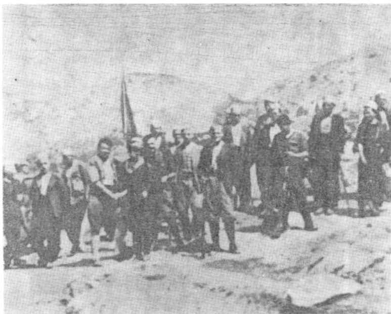
Çetat e para partizane

konin për herë të parë në çetat partizane mbrojtësit e tyre, ushtrinë e tyre dhe i ndihmonin e i përkrahnin pa u kursyer. Shtëpitë e kasollet e fshatarëve u bënë strehë për partizanët. Në qytete e fshatra populli i thjeshtë ndihmonte partizanët me ç'të kishte: para, veshmbathje, ushqim, ilaçe etj. Me mjetet financiare të dhuruara nga populli u krijua fondi i Luftës Nacionalçlirimtare.