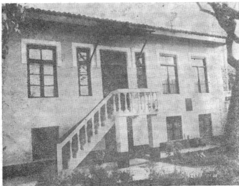
Shtëpia ku u themelua Partia Komuniste e Shqipërisë

për të shmangur luftën popullore prej udhës së drejtë, prej udhës së luftës kundër fashizmit». 1