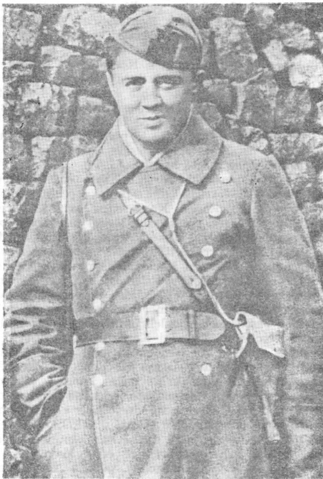
Shoku Enver Hoxha — Sekretar i Përgjithshëm i PKSh

Konferenca e Parë Kombëtare e PKSh zgjodhi Komitetin Qendror të përhershëm dhe Enver Hoxhën Sekretar të Për-