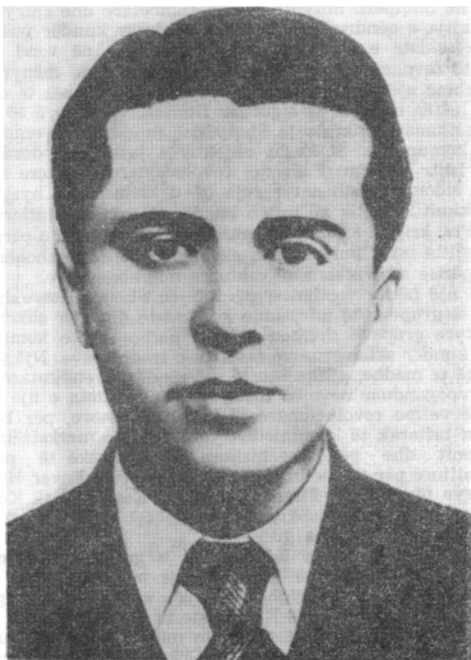
Shoku Enver Hoxha — themelues dhe udhëheqës i Partisë Komuniste të Shqipërisë

këpamjeve likuidatore të shprehura nga Anastas Lula e Sadik Premtja, të cilët në fakt ishin kundër krijimit të një Partie Komuniste në Shqipëri dhe mohonin në mënyrë të veçantë rolin udhëheqës të Partisë në Luftën Nacionalçlirimtare. Me shokun Enver Hoxha ishin Qemal Stafa dhe shumica e pjesëmarrësve. Mbledhja përfundoi me ngadhënjimin e parimeve të marksizëm-leninizmit. Pozitat dhe pikëpamjet e elementëve antiparti e likuidatorë u demaskuan dhe u dënuan me vendosmëri si antimarksiste dhe antikombëtare.