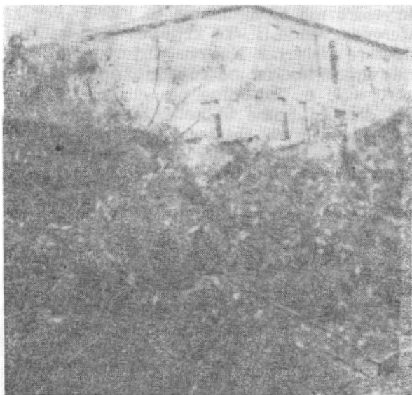
Pamje e jashtme e shtëpisë ku u mbajt Konferenca I e Vendit

prej 17-22 mars. Ajo i kushtoi vëmendjen kryesore përgatitjes së popullit për kryengritjen e përgjithshme popullore dhe organizimit saj.