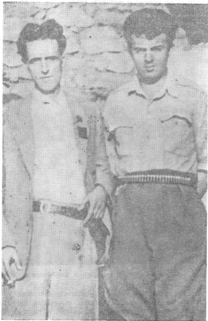
Enver Hoxha me Myslim Pezën

nga Partia Komuniste e kishin rritur autoritetin politik të saj në gjithë vendin. Deri në verën e vitit 1942 programin e Partisë e kishin njohur e përqafuar masat e gjera të popullit shqiptar. Në ato çaste të hovit revolucionar e të rritjes së ndërgjegjes të masave popullore, në fillim të korrikut 1942, KQ i PKSh vendosi thirrjen e një konference