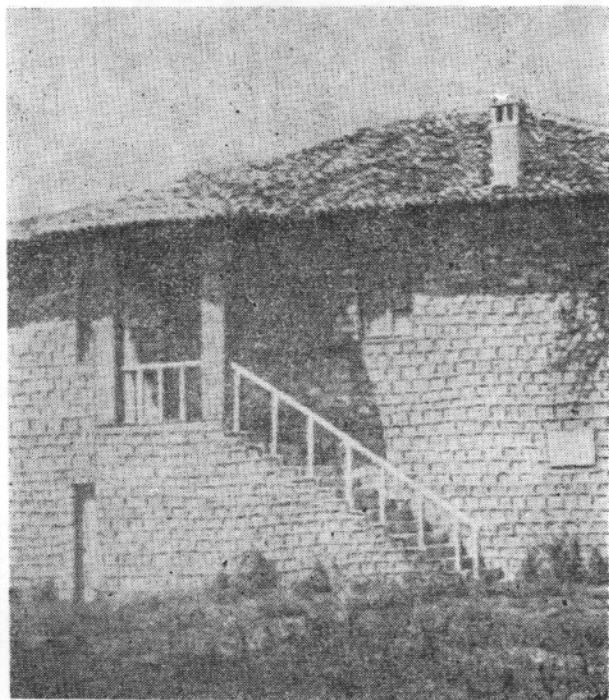
Pamje e jashtme e shtëpisë ku u mbajt Konferenca e Pezës

Në vazhdim të Konsultës së Parë të Aktivit të Partisë, në fund të qershorit, u mbajt Konferenca e Jashtëzakon-