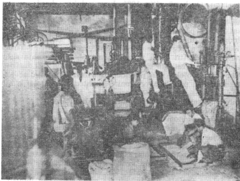
Fabrikë mielli (vitet 30)

1923-1928 ishin shoqëria industriale e duhanit STAMLES në Durrës, Shoqëria industriale e duhanit SAIDE në Elbasan, Shoqëria Gjenerale e Elektrikut në Korçë, Shoqëria tregtaro-industriale e kripës SITA në Tiranë, Shoqëria industriale e elektrikut SESA në Tiranë, Shoqëria industriale e Portland Çimentos në Shkodër, Shoqëria «Dele» për prodhimin e qilimave në Gjirokastrë, Shoqëria industriale e alkoolit «Mercur» në Drenovë të Korçës. Në fakt shoqëritë