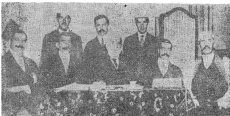
I. Qemali, L. Gurakuqi e I. Boletini si pjesëtarë të delegacionit që shkoi në Londër

të Zi gjithë liqeni i Shkodrës dhe Mali i Taraboshit, kurse Serbisë — Gjakova, Dibra dhe Luma. Meqënëse kjo u kundërshtua në bllok nga fuqitë e Tripalëshit, Konferenca e Ambasadorëve hasi në një pikë të vdekur. Për më se një muaj bisedimet u zhvilluan jashtë Konferencës, por gjithmonë me ndërmjetësinë e ministrit të Jashtëm anglez. Për ta zgjidhur çështjen të dy palët u detyruan të bënin lëshime të reja. Rusia hoqi dorë nga kërkesat mbi liqenin e Shkodrës, Taraboshin dhe Lumën; kurse Austro-Hungaria, e shqetësuar për fatin e Shkodrës, që rrezikohej të binte në duart e serbo-malazezëve, vendosi të sakrifikoje edhe Gjakovën. Më 22 mars Konferenca u mblodh për të sanksionuar marrëveshjen përfundimtare të Fuqive mbi kufijtë e veriut. Në kundërshtim të hapët me parimin e kombësisë dhe të vullnetit të popullsisë vendase, nga trangu i Shqipërisë u shkëputën Kosova dhe tokat shqiptare në Maqedoni, të cilat dënoheshin të kalonin në zgjedhën e huaj serbo-malazeze.