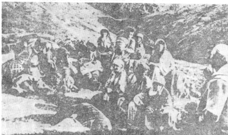
Muhaxhirë nga Kosova

me vullnetin e Fuqive të Mëdha, bashkimi i tyre me atdheun — Shqipërinë e pavarur. Ndërsa H. Prishtina caktohej në shtator ministër i qeverisë së Vlorës, B. Curri, I. Boletini, E. Isufi etj. u ngarkuan me organizimin e kryengritjes në vend.