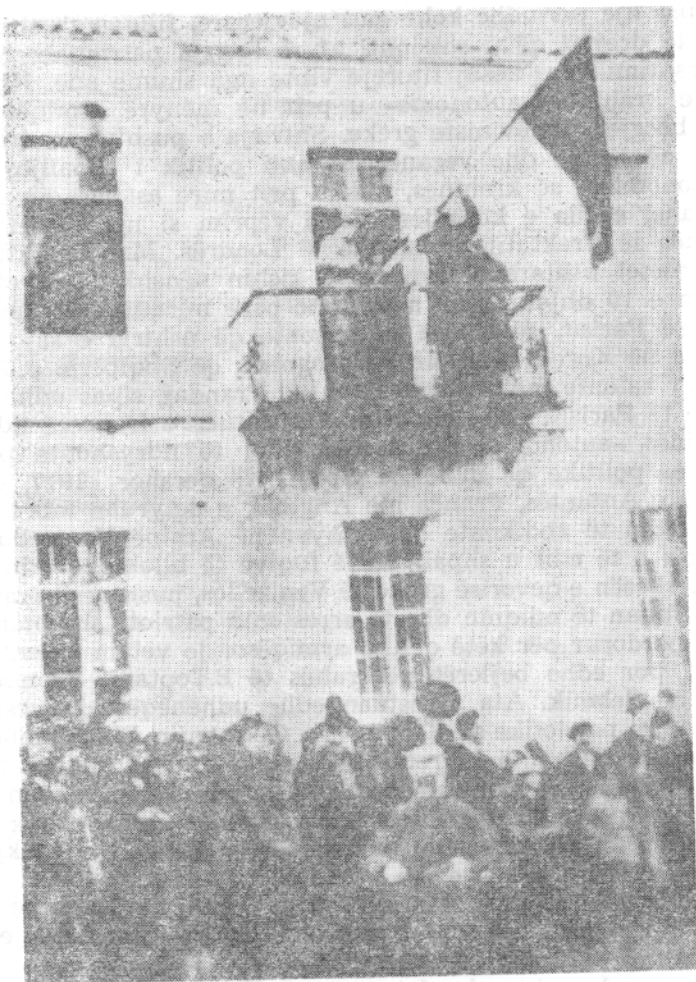
Korçë, 10 dhjetor 1916: Shpallja e krahinës «autonome» dhe ngritja e flamurit

«autonome», jo vetëm që u pranua nga pushtuesit francezë karakteri etnik shqiptar i popullsisë së trevës, por u krijuan edhe kushte të përshtatshme për të luftuar më me forcë pretendimet shoviniste greke mbi Shqipërinë e Jugut, për t'i bashkuar edhe më fort masat popullore dhe për të organizuar më mirë qëndresën e tyre kundër një agresioni të ri nga ana e forcave të armatosura greke.