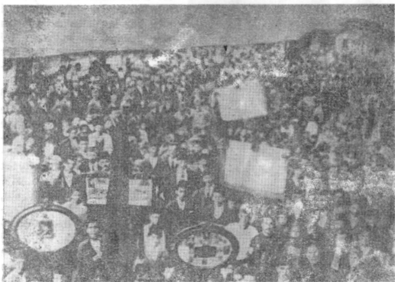
Berat, gusht 1924: Demonstratë antifeudale

«Ndigjojmë se shtetet e tjera demokratike... i heqin bujkut zgjedhën e robërisë... e paralizojnë aristokracinë dhe në këtë mënyrë sigurojnë qetësinë dhe simpatinë qeveritare», shkruanin midis të tjerave fshatarët e Pitakës (Durrës) në letrën drejtuar kryeministrit. Pa prituri zbatimin e masave qeveritare, bujqit në disa raste vepruan me nismën e tyre për të hequr qafe shfrytëzimin e çifligarëve.