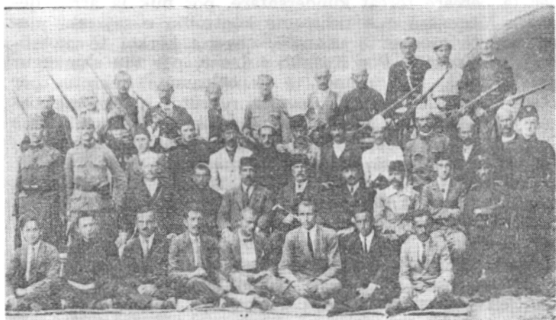
Bajram Curri në mes të një grupi nga Malësia e Gjakovës, pjesëmarrës në Revolucionin e Qershorit e përkatës të tij

zuan në qytet një demonstratë antiqeveritare, ndaj së cilës xhandarmëria lokale nuk pranoi të hapte zjarr, sikundër kishte urdhëruar prefekti i atjeshëm. Nga radhët e demonstruesve u formua një batalion vullnetarësh të organizatës «Bashkimi».