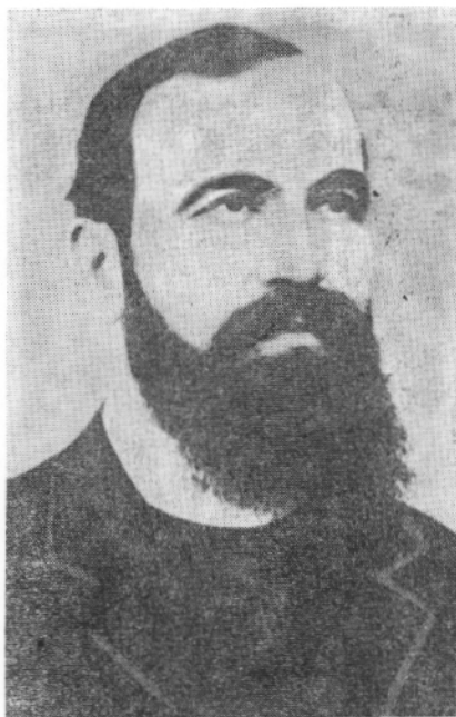
Fan S. Noli

Në fushën ekonomike e shoqërore qeveria parashikonte «çrrënjosjen e feudalizmit» duke marrë një varg masash që do të çonin në përmirësimin e gjendjes së mjeruar të fshatarësisë dhe të masave punonjëse të qytetit; të lehtësonte hyrjen e kapitalit të huaj por edhe të mbronte dhe organizonte kapitalet e vendit.